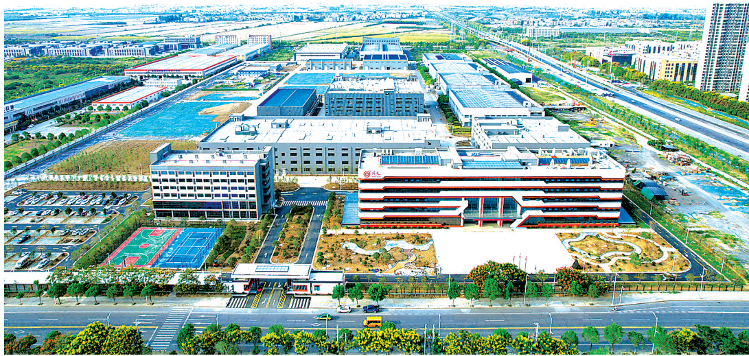
湖北回天新材料股份有限公司制造基地

从车间厂房到商圈楼宇，从招商一线到民生基层，襄阳高新区正以党建链串起产业链、激活人才链、赋能治理链，探索党建引领高质量发展的“红色密码”。襄阳高新区用实践证明：党建做实了就是生产力，做强了就是竞争力，做细了就是凝聚力。