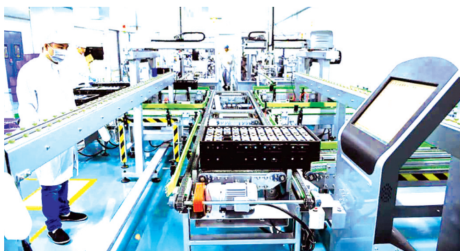
湖北骆驼蓄电池研究院有限公司生产车间