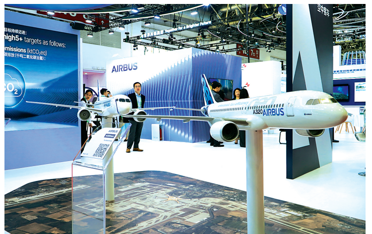
空中客车展台