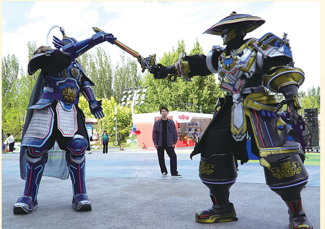
巡游机甲进行场景演示