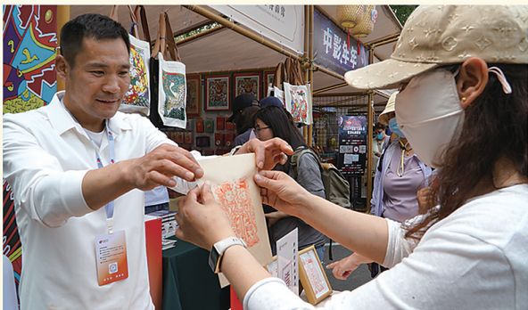
游客体验北京木版年画印刷过程

5月15-24日,以“文润美好·创享生产·潮向未来”为主题的首届中国新文创市集暨潮玩游园会(CNCTC 2026 CHINA)在北京朝阳公园举办。这是全国首个综合性国家级文创主题市集。