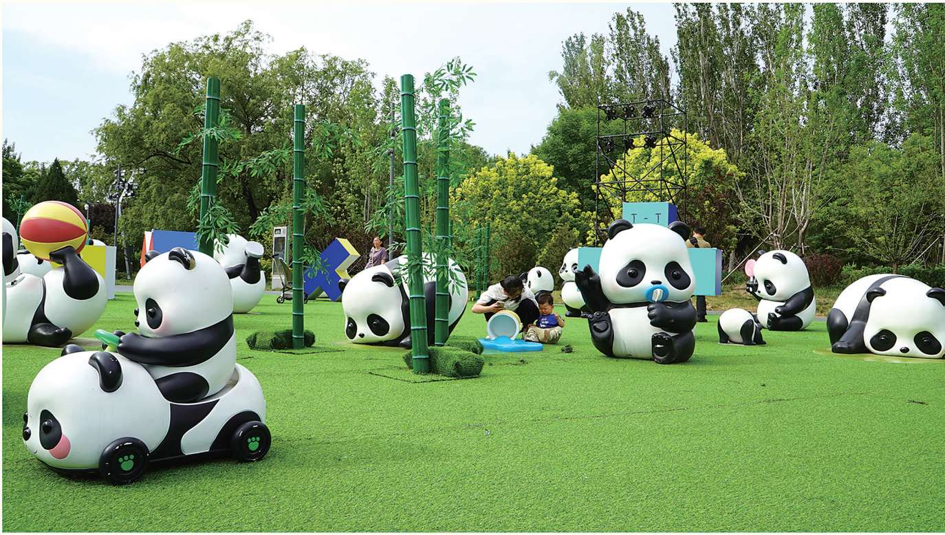
Panda Roll胖哒幼森林主题空间