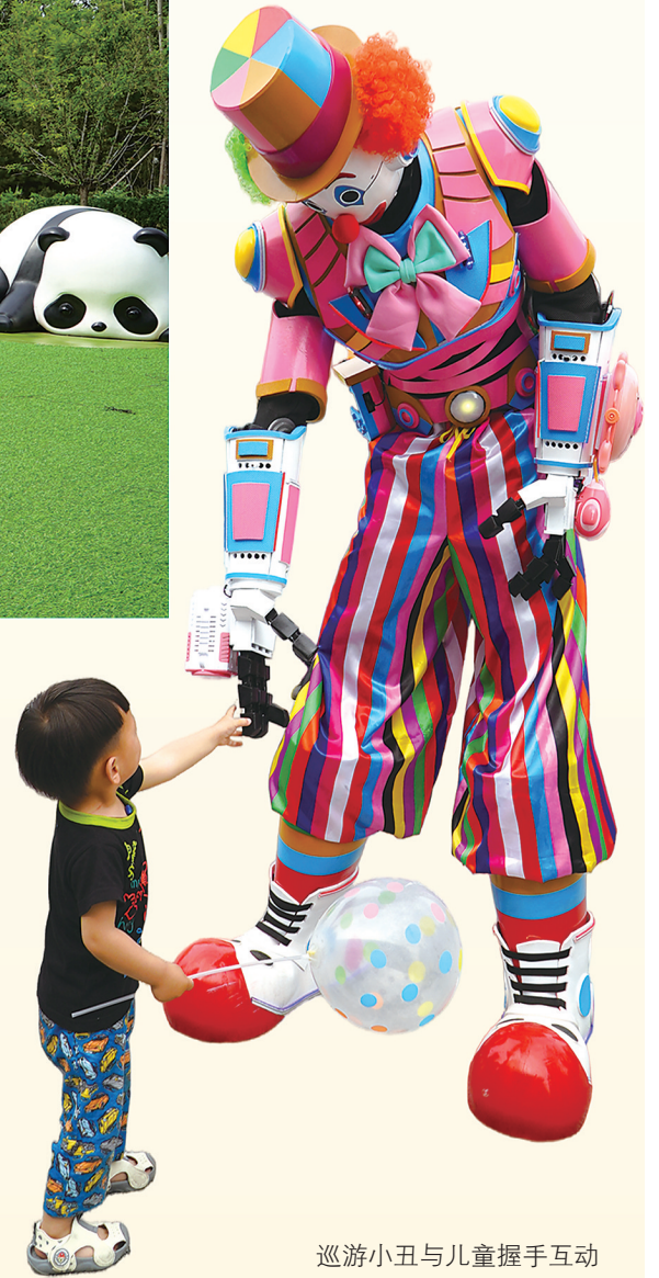
巡游小丑与儿童握手互动