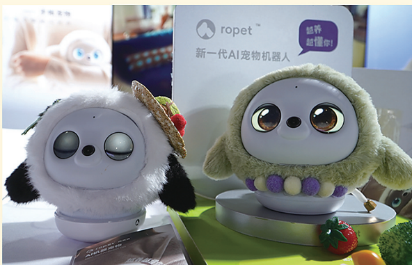
新一代AI宠物机器人

该活动主场地面积6.6万平方米,汇聚来自全国31个省(区、市)+新疆生产建设兵团+港澳地区的文创、非遗老字号、原创IP和潮玩品牌,打造集传统文化与现代潮流于一体的文创消费新场景。