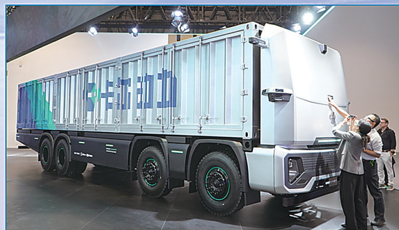
卡尔动力和陕汽重卡共同打造的量产版运输机器人