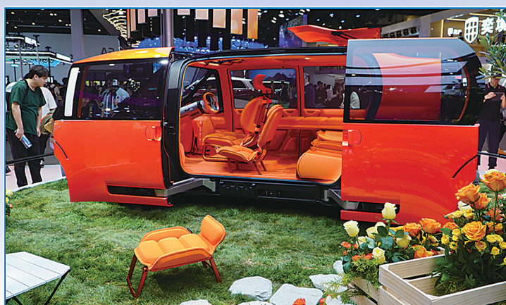
雪铁龙ELO概念车亚洲首秀

2026(第十九届)北京国际汽车展览会(Auto China)于4月24日至5月3日在北京举办。本届车展以“领时代 智未来”为主题,共展出车辆1451台,其中首发车181台、概念车71台,吸引128万人次入场参观,刷新历史纪录。本届车展是一场覆盖全产业链、汇聚全球智慧的汽车科技盛宴,更是全面展现汽车智能出行的新风向。