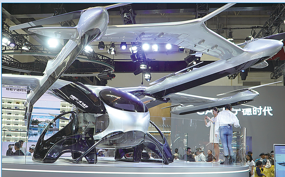
宁德时代与峰飞航空联合打造的V2000EM盛世龙电动垂直起降飞行器