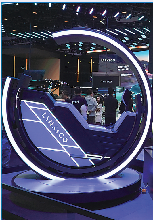
领克展台的模拟赛车体验设备