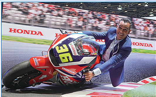
观众在本田摩托车压弯拍照体验专区打卡