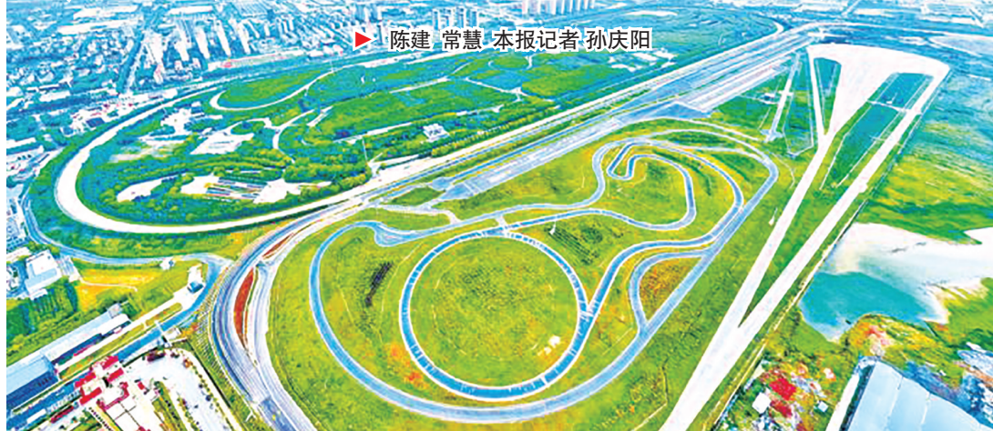
襄阳达安汽车检测中心智能网联汽车试验场

“十五五”开局之年，襄阳高新区“攀高向新 笃行实干”，锚定产业高地、技术高地、创新高地、开放高地、财富高地“五个高地”战略目标，在高质量发展的征程全速疾驰。从顶层设计到基层实践，从产业升级到民生改善，襄阳高新区正在新时代的答卷上书写高新精彩篇章。