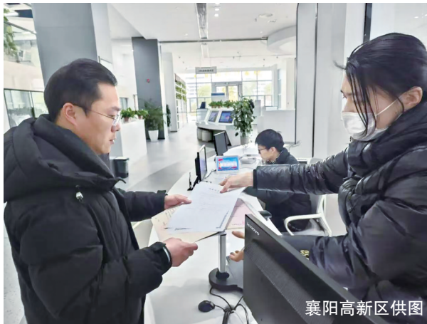
襄阳高新区政务服务中心

起服务“连心桥”,推动服务效能由“被动响应”转向“主动作为”,国家高新区紧盯企业最急迫、最现实的需求,强化跨部门、跨领域协同,真正打通政策落实的“最后一公里”,让企业在高质量发展中有了实实在在的获得感。