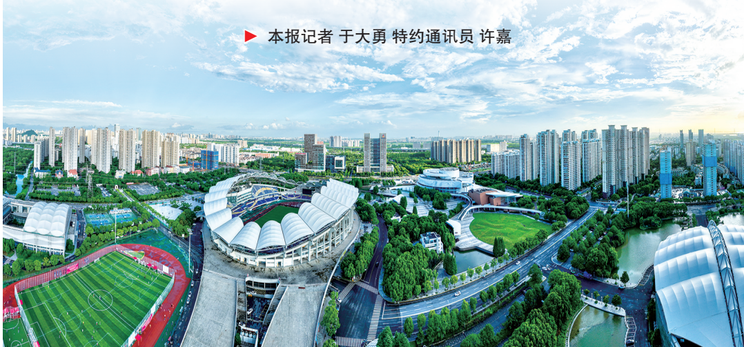
高质量发展的昆山高新区

一个个重大项目建设串“珠”成“链”，一条条优势产业链不断延伸拓展聚“链”成“群”，赋能昆山高新区工业经济聚优成势。作为昆山市科技创新的主阵地，2025年以来，昆山高新区扎实做好“高”和“新”两篇文章，以优质服务破除壁垒、以市场拓展挖掘增量、以业态创新谋取突破，全力以赴抓经济、千方百计促发展，不断做大经济总量、提升发展质量，坚决打赢决战决胜的收官战。