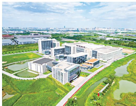
中科可控信息产业有限公司