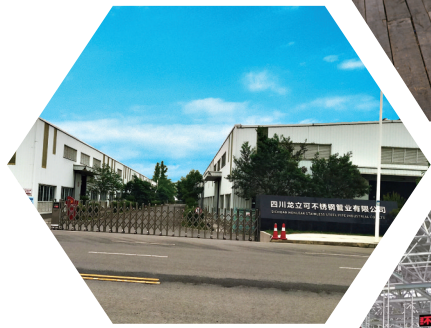
四川龙立可不锈钢管业