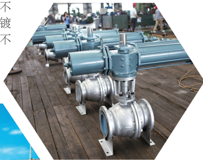
四川精控阀门车间

据了解,德阳高新区各企业当前正以昂扬的斗志、饱满的热情,奋力冲刺一季度“开门红”,推动传统优势产业转型升级,以关键核心技术突破推动产业向中高端迈进,为全年高质量发展奠定坚实基础。