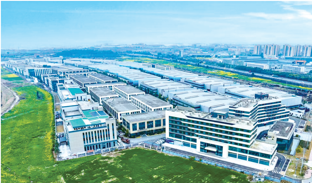
南山控股(德阳)智能制造产业园

人勤春来早,奋进正当时。德阳高新区各企业以昂扬的斗志、饱满的热情,奋力冲刺一季度“开门红”,推动传统优势产业转型升级,以关键核心技术突破推动产业走向中高端,为全年高质量发展奠定坚实基础。