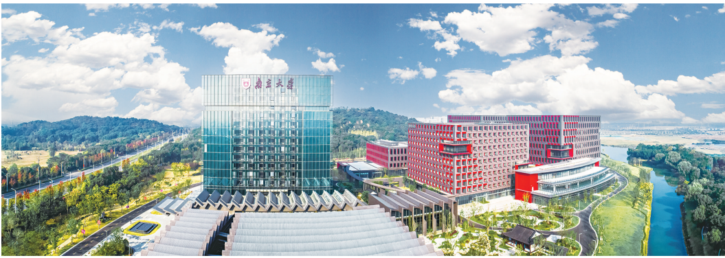
南京大学苏州校区正式启用,重点打造五大学科群、七大学院、十大研究院和四大研究中心。