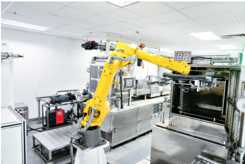
苏州高新区企业国巨电子不断推进新型工业化,加快发展新质生产力。