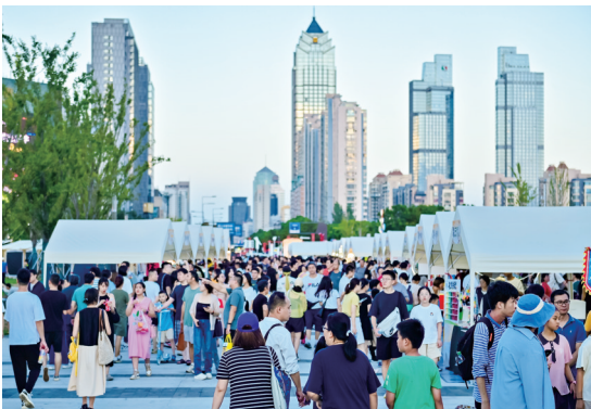
今年国庆节期间,狮山市集人气爆棚,成为城市文旅消费新品牌。

接下来,苏州高新区将一如既往地招商引资作为“生命线”,把项目建设作为高质量发展的“强引擎”,深入谋、全力招、扎实推、抓紧建,推动招引项目数量质量、科技含量稳步提升,持续招大引强、扩大“朋友圈”,以营商环境之“优”,推项目建设之“进”,撑经济发展之“稳”。