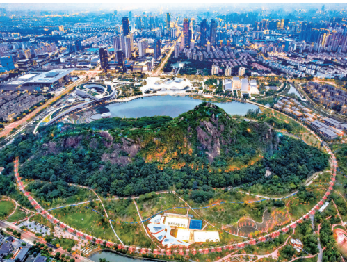
狮山文化广场汇集苏州博物馆西馆、苏州狮山大剧院、苏州科技馆等载体,着力打造苏州城市新地标、人文会客厅。