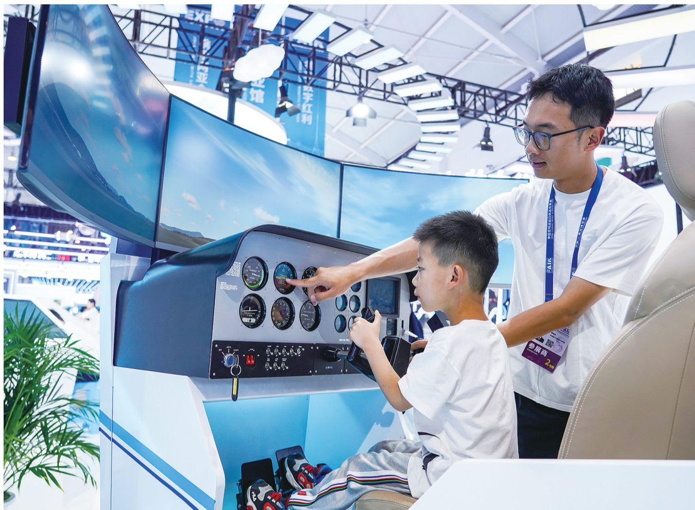
7月23日至28日,第八届中国—南亚博览会在昆明举办。数字经济、人工智能、绿色能源、低空经济等领域“科技范”十足的展品吸引众多观众参观、体验。图为7月25日,小朋友在第八届南博会上体验飞行训练器。