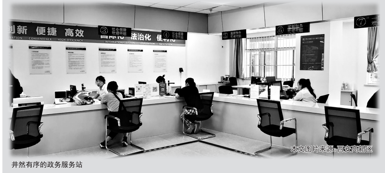
井然有序的政务服务站