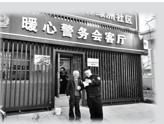
暖心警务会客厅虽小，但服务能力不可小觑。