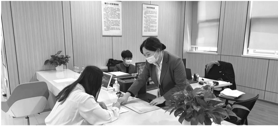
“人才管家”办理档案转存服务。