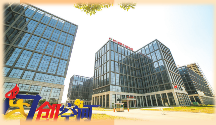
国家级孵化器——上理理工大学国家大学科技园