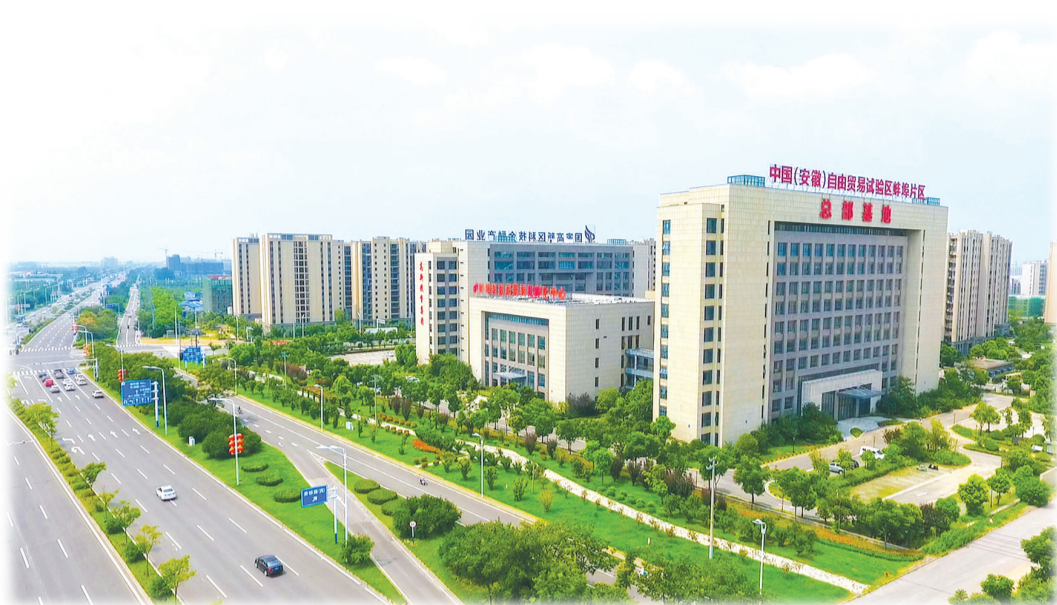
安徽自贸试验区蚌埠片区总部基地

促进企业集聚。围绕硅基、生物基、新能源产业,深化制度创新,优化项目服务,强化企业集聚,截至2021年11月底,蚌埠片区共有存量企业2343家,累计新增注册企业1206家,其中“四上”