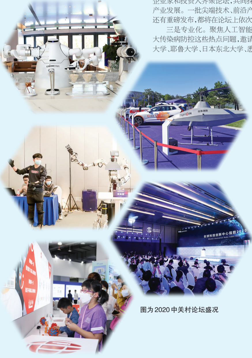
图为2020 中关村论坛盛况

9月24-28日,2021 中关村论坛主会期结束后,常态化系列活动仍将持续开展,打造“永不落幕”的中关村论坛。