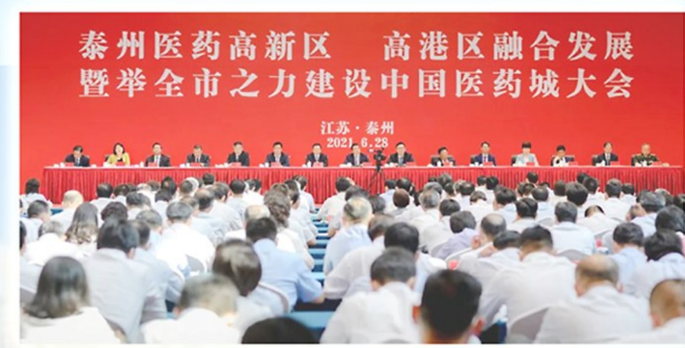
2021年6月举行的泰州医药高新区、高港区融合发展暨全市之力建设中国医药城大会。