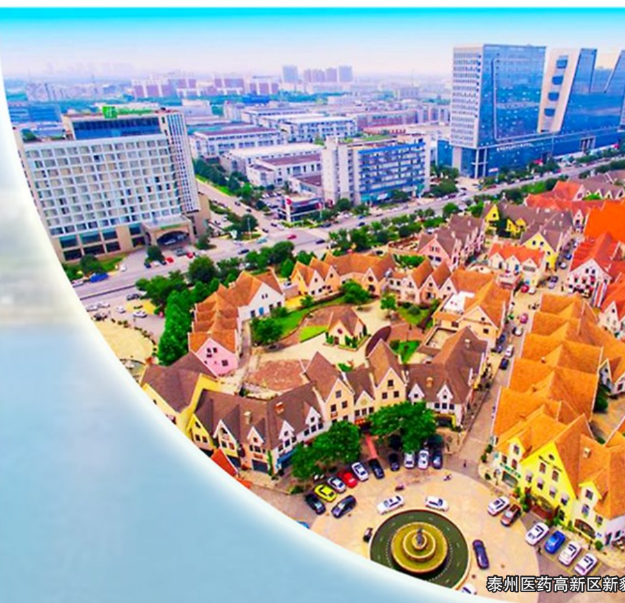
泰州医药高新区新貌