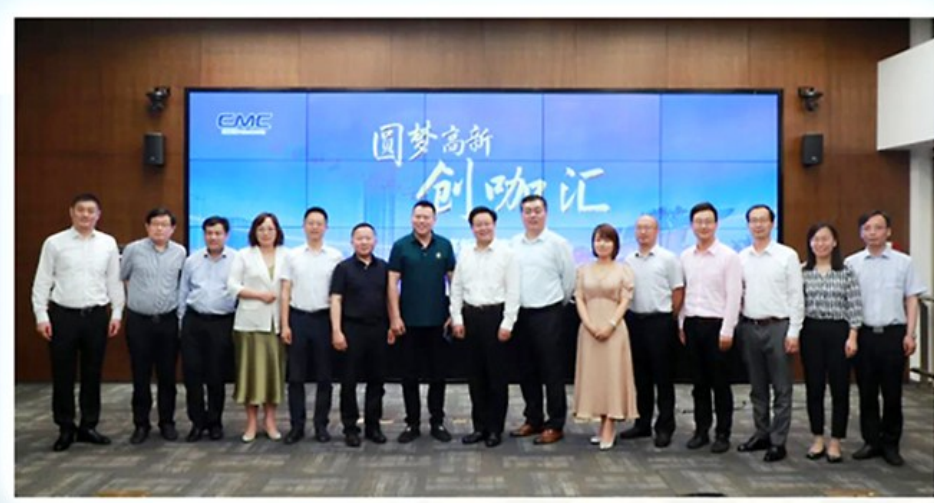
泰州医药高新区企业家的“创咖汇”