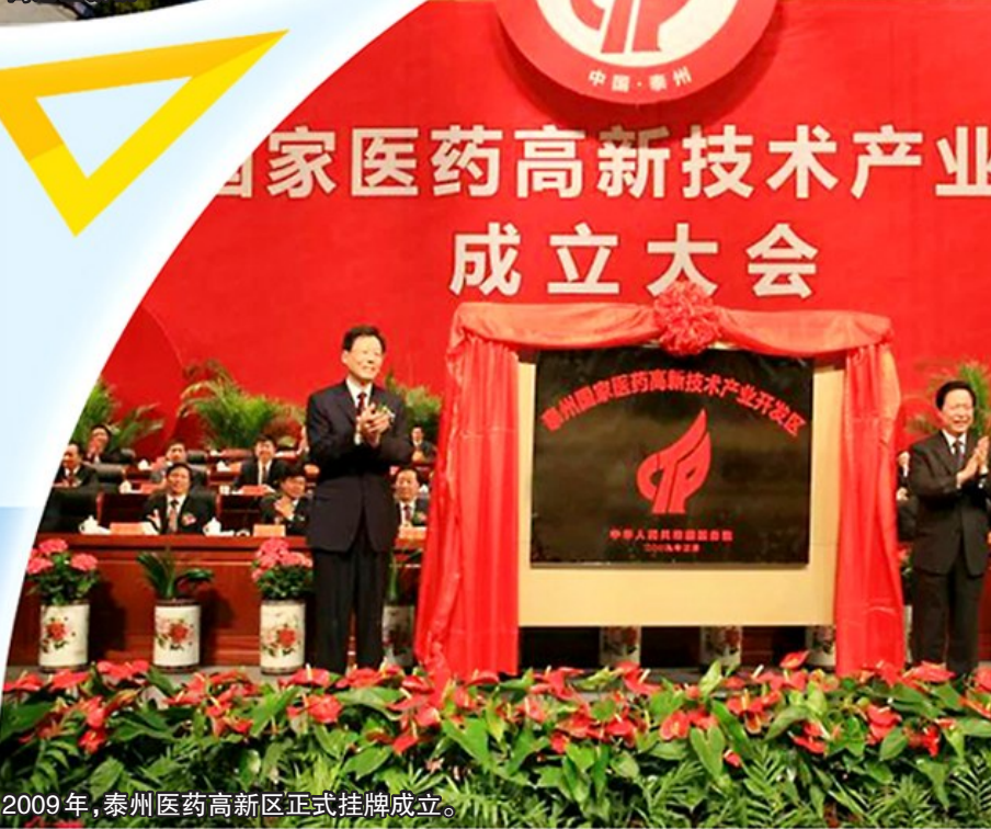
2009年,泰州医药高新区正式挂牌成立。