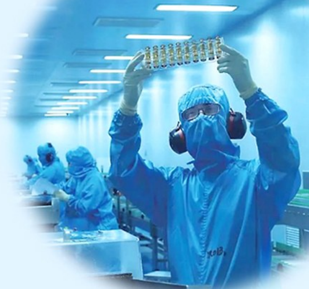
医药企业科研人员在生产车间。

近年来,泰州医药高新区(高港区)每年新增财力的80%以上用于民生事业,脱贫攻坚取得全面胜利,建档立卡经济薄弱村和低收入农户全部脱贫。围绕“办好人民满意的教育”,系统谋划部署教育优先优质发展,凤凰小学教育集团周山河小学、江苏省泰中附中教育集团周山河初中正式挂牌。市区人民医院紧