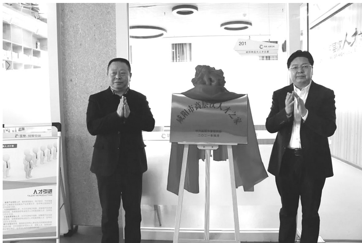
日前,咸阳市高层次人才之家在咸阳高新区揭牌。咸阳市将发挥好“人才之家”服务平台作用,优化人才发展环境,增强专家人才的荣誉感、自豪感和归属感,把咸阳打造成人才高地和人才强市,为咸阳市“增量提质、高点开局”提供人才和智力支撑。

“栽下梧桐树,引来金凤凰”。接下来,中关村丰台园将把优化营商环境作为政府促进产业集群发展的首要任务,不断强化服务意识,秉承“有求必应、无事不扰”的店小二精神,做好企业服务的加法和简化审批、减税降费的减法,预计到2022年将中关村丰台园建设成为全国领先的轨道交通产业创新中心。