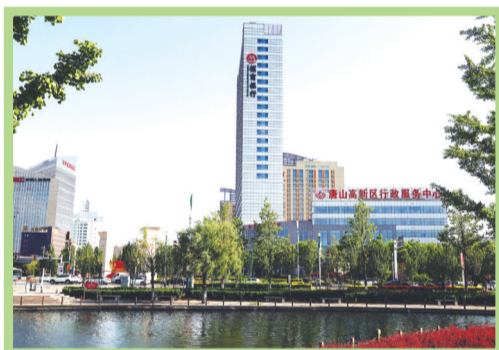
唐山高新区行政服务中心