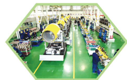
中信重工开诚智能装备有限公司特种机器人生产车间