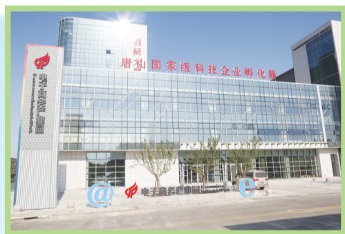
唐山国家级科技企业孵化器