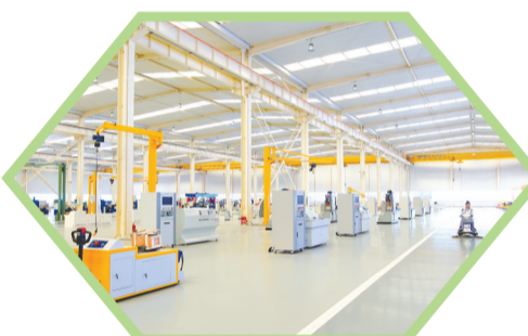
百川智能公司生产场景