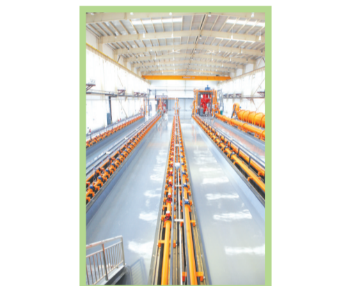
汇中仪表股份有限公司检定车间

目之一,也是唐山打造国家级现代应急装备产业基地的重大支撑项目,将有力推动唐山市应急产业向特色园区聚集、向智能高端延伸、向全产业链迈进。