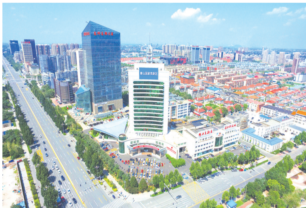
唐山高新区火炬大厦

奋进“十四五”,唐山高新区将进一步强化在唐山高质量发展中当标兵作示范的信念,赋能创新优势、补齐发展短板、优化营商环境,向科技前沿进军,向产业高度迈进,向内生动力聚集,奋力夺取疫情防控和经济社会发展双胜利。