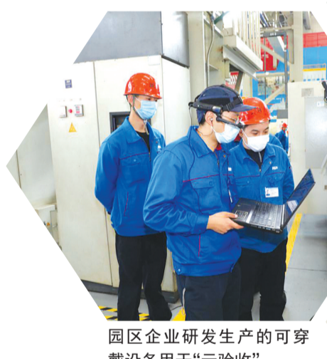
园区企业研发生产的可穿戴设备用于“云验收”

济南高新区还注重“环境招商”。围绕生物医药、智能装备、信息技术等主导产业补链强链,争取招引实施一批有利于建链、延链的项目,推动构建企业集聚、产业集群、要素集约、服务集中的产业生态体系。在项目落地地上,突出“要素跟着项目走”,对列入各级各类重点库的项目,优先配置土地资源、优先保障建设资金、优先提供人才支持、优化法治保障环境,集中优势资源保障项目良性发展。对事关全局和长远的重点项目,