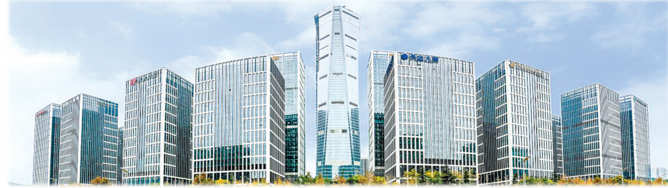
生物医药互联网+线上线下销售大平台