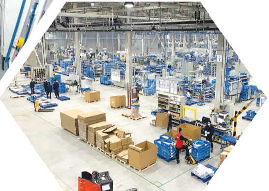
费斯托全球生产中心

载体引领带动作用不断发挥,中科院多个研究所落户,济南高新区先行先试,进一步变招商“引”资为招商“选”资,确保真正落地一批大科学计划、大科学工程,建设一批重大科学基础设施。