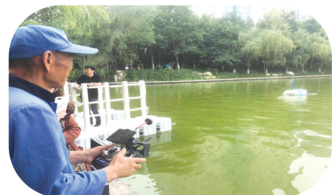
陕西欧卡电子智能科技有限公司首创的无人环保船正在打捞作业

经过多年探索和创新,西安高新区创业园以独具特色的“1+N”孵化器集群式发展和“苗圃+孵化器+加速器+科技园区”的科技创业全链条孵化,打造出中国科技企业孵化器五大模式之一