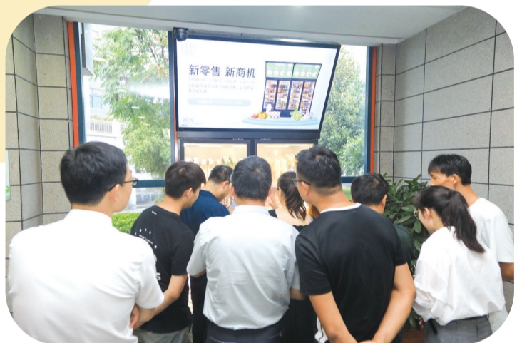
西安未来鲜森智能信息技术有限公司研发的新零售智慧无人货柜