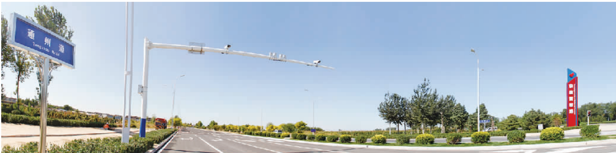
唐山高新区京唐智慧港一景