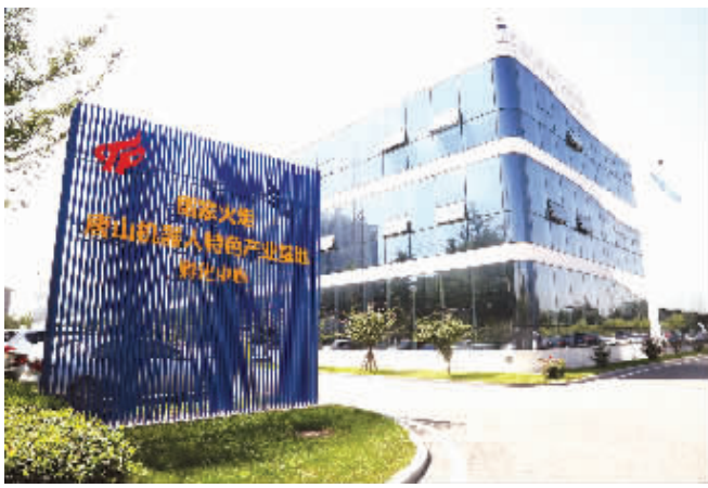
国家火炬唐山机器人特色产业基地孵化中心

莫道去年春将尽,今年春色倍还人。2019年,唐山高新区将紧紧围绕“做示范、当引擎”总要求,继续突出“稳中求进、进中争先”总基调,坚持新发展理念,深入落实唐山市“高质量发展突破年”各项部署,聚力产业发展,在转型升级中推动高质量发展,坚持深化供给侧结构性改革,坚决贯彻落实“巩固、增强、提升、畅通”八字方针,通过产业提质,做实机器人产业园和通州产业园,做大电子商务基地和两化融合示范基地,加快构建现代产业体系,全面提升产业核心竞争力,培植起高质量发展的厚实根基;聚力创新驱动,在增创优势中推动高质量发展,坚持深入实施创新驱动战略,围绕聚集创新资源、创新主体、创新人才,实施“十百千”工程,培育10家行业领军企业、100家高新技术企业、1000家科技型中小企业完善创新创业生态,加快构建充满活力的区域创新体系,推动形成高质量发展的强大引擎;聚力城乡统筹,在产城融合中推动高质量发展,坚持产城融合发展,高水平开发京唐智慧港,高品质改造提升主城区,高标准改善农村人居环境,进一步优化城市空间布局,提升城市功能品质,建设现代化新城区,奠定高质量发展的坚实基础;聚力污染防治,在生态改善中推动高质量发展,牢固树立“绿水青山就是金山银山”的理念,继续以铁的决心、铁的措施、铁的手腕坚决打赢污染防治攻坚战,强力推进污染退城、清水润城、城市增绿“三城”工作,让高新区的天更蓝、水更净、空气更清新,跨越高质量发展的关键关口;聚力改革开放,在释放活力中推动高质量发展,坚持全面深化改革,扩大开放,进一步激发市场活力和内生动力,积极开展“三深化三提升”活动,创优营商环境,打造“审批事项最少、收费标准最低、办事效率最快、服务水平最优、高新最好”“五最”品牌,形成高质量发展的强大动能;聚力民生改善,在共建共享中推动高质量发展,坚持以人民为中心的发展思想,统筹推进各项社会事业,着力实施10件惠民实事,努力为群众提供更加优质、高效、安全的服务,不断增强人民群众的获得感、幸福感、安全感,加快建设“实力高新、活力高新、美丽高新、幸福高新”,奋力推动高质量发展,以优异成绩庆祝新中国成立70周年。