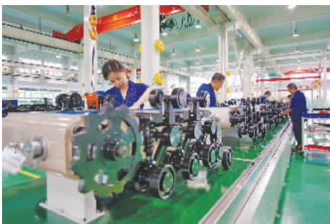
中信重工开诚智能机器人生产线