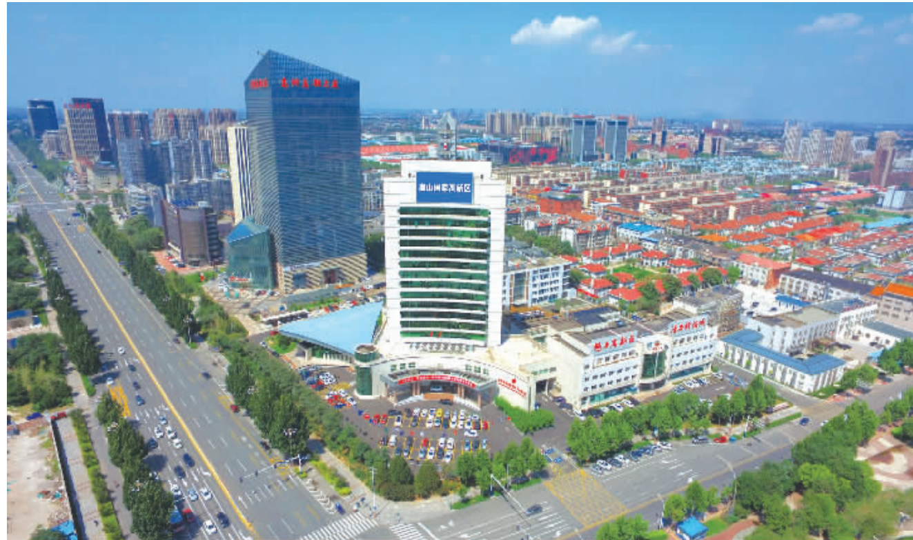
唐山高新区火炬大厦

高新技术企业多。2018年,唐山高新区新认定高新技术企业53家,累计达到117家,高企总数两年翻了一番,实现倍增;新认定科技型中小企业185家,总量达到940家;开