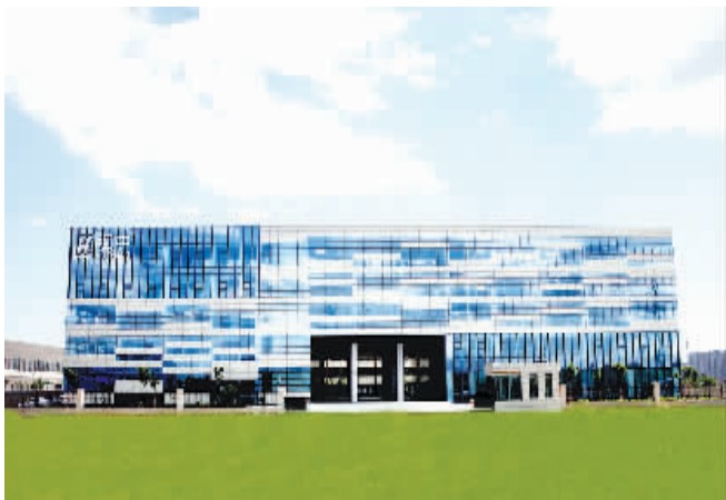
汇中仪表股份有限公司外景