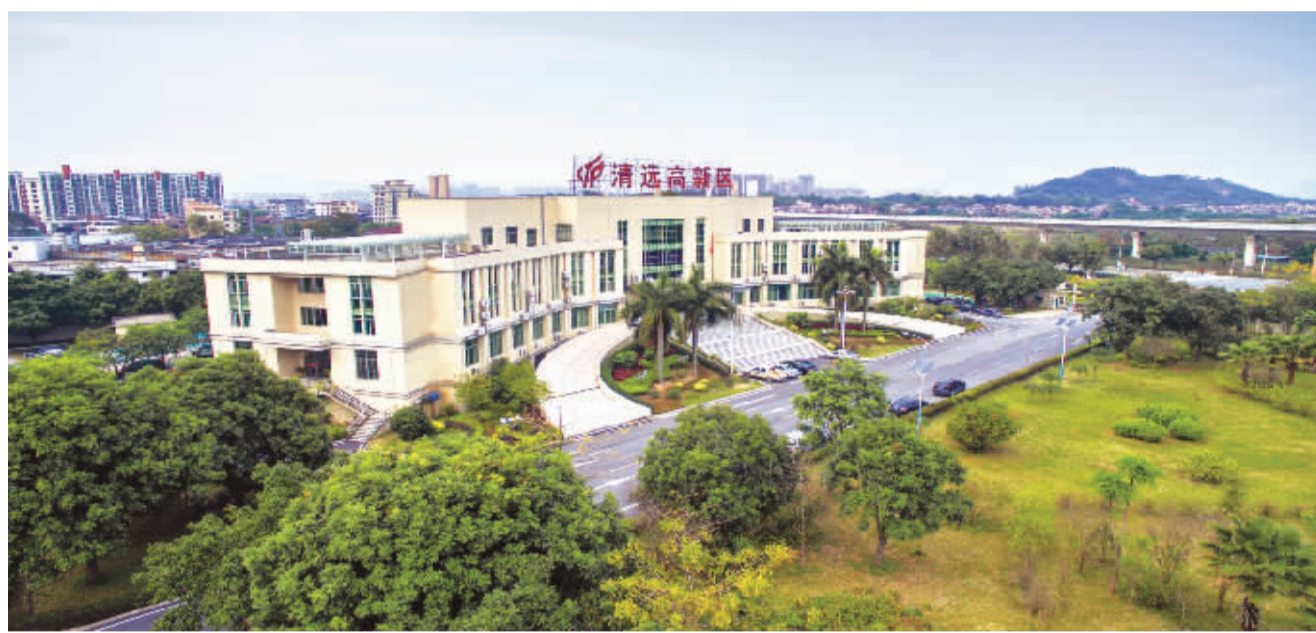
清远高新区管委会

2019年,清远高新区将继续奋勇向前、披荆斩棘,抢抓粤港澳大湾区建设机遇,重点围绕创建创新型特色园区、打造粤北科技创新中心精准发力,加快成为粤港澳大湾区发展腹地,推动经济实现高质量发展。