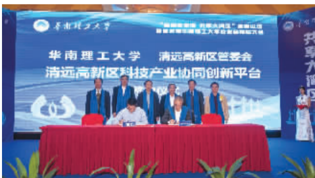
清远高新区与华南理工大学签约共建科技产业协同创新平台

清远高新区充分发挥科技平台和专业机构的承载作用,科技创新能力显著提升,重点加强对天安智谷、华南863科技创新园等科技平台的专业化运作指导,形成规范高效的管理服务体系,抓好入园项目的引进和服务,推动一批高质量的新产业、新业态初创新型项目进驻科技园和孵化器。