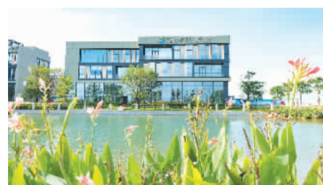
广东聚航新材料研究院