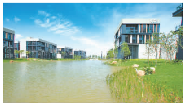
清远天安智谷产业园

此外,清远高新区不断健全完善人才创新创业服务体系,对高层次人才提供“两个清单”“四个帮办”服务(即服务清单、政策清单;引进落户、创办企业、人才政策兑现、社保医疗教育等服务),为高层次人才提供全方位、全过程服务,切实做到“用感情留人、用事业留人、用优厚的待遇留人”,努力把清远高新区打造成为高层次人才流入的“洼地”。