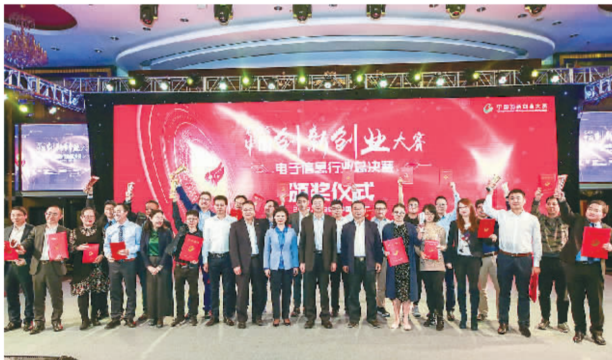
11月30日，第七届中国创新创业大赛电子信息行业总决赛在深圳落幕。最终，真微科技(广州)有限公司、大连达利凯普科技有限公司分获初创组和成长组一等奖。至此，第七届中国创新创业大赛圆满落幕。

石河子高新区于 2013 年 12 月升级为国家高新区。目前，石河子高新区正积极抢抓丝绸之路经济带建设机遇，以培育创新创业生态，引领新兴经济增长点为主线，重点实施构建产业生态、创新生态、空间生态、开放生态四大战略任务，探索“大众创业、开放式创新、平台经济、借力发展、科技招商”五大行动路径，全力打造成为支撑新疆生产建设兵团转型跨越的战略支点，引领示范兵团创新发展。