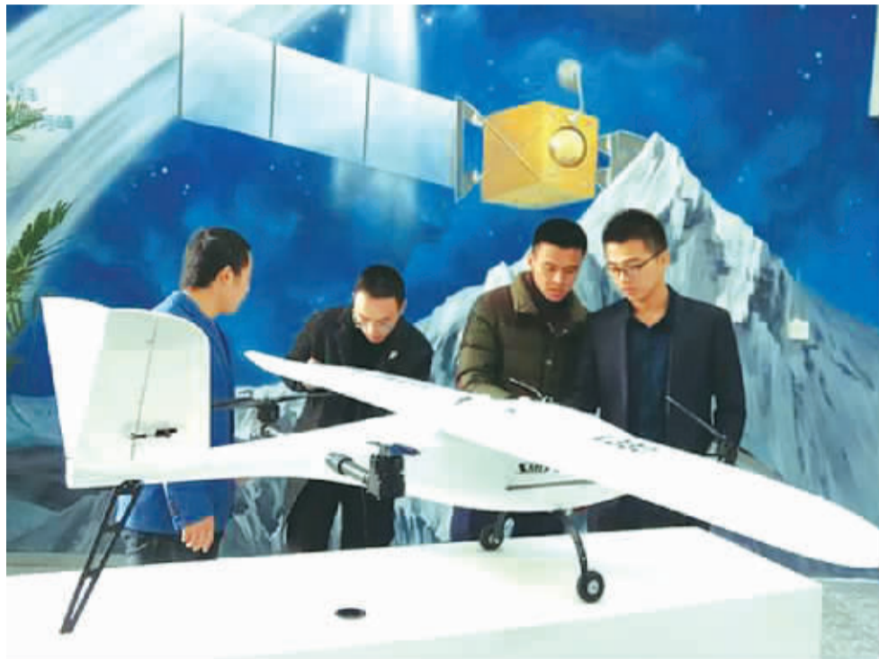
中新天津生态城北航空众创空间孵化项目“灵翼飞航”

据介绍,未来,中新天津生态城还将结合产业发展规划,制定符合区域需求的孵化机构引入机制,为“双创”载体的发展奠定基础,也为区域内科技企业的发展提供智力支持,打造创新创业高地。